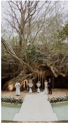
San Pedro Ochil