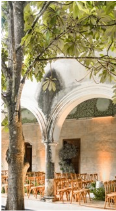
Tekik de Regil